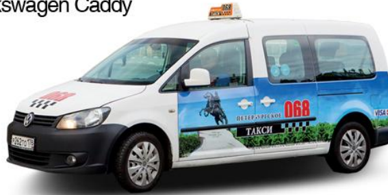
"Минивен" Volkswagen Caddy