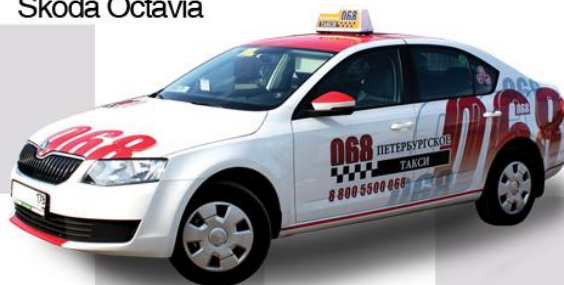
"Комфорт класс" Skoda Octavia